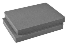
1602 Pick N Pluck™ Sections Only (set of 2)