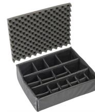
1605 Divisores acolchados