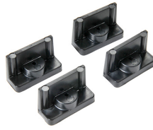
1507 Soportes de montaje rápido - juego de 4