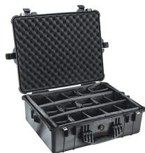
1604 With Padded Dividers