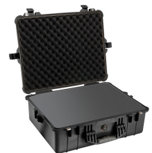
1600WF With Foam