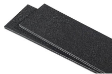
1510TPDIV Extra TrekPak Dividers