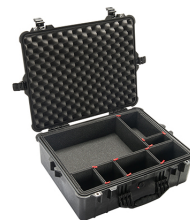
1600TP With TrekPak Divider System