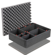
1600TPKIT Kit de divisores TrekPak