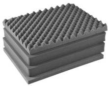
1601 Juego de 4 piezas de espuma de recambio