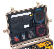
1609 Organizador de tapa